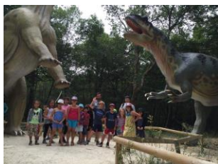
Sortie de l'ALSH