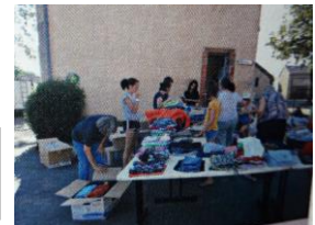
Soirée tri de vêtements