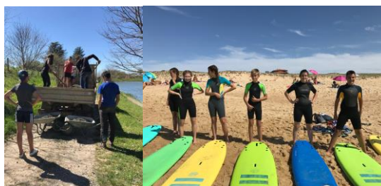
Activités avec les jeunes