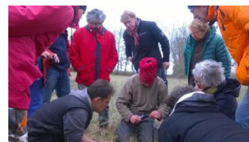
Atelier "Taille et greffe d'arbres fruitiers"