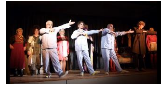
Représentation de théâtre