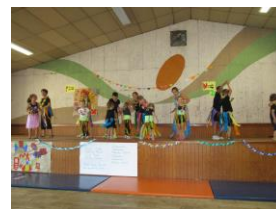
Spectacle de l'ALSH