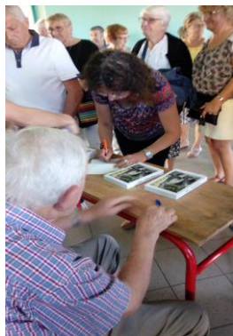
Séance de dédicace du livre « Il était autrefois Vénès »