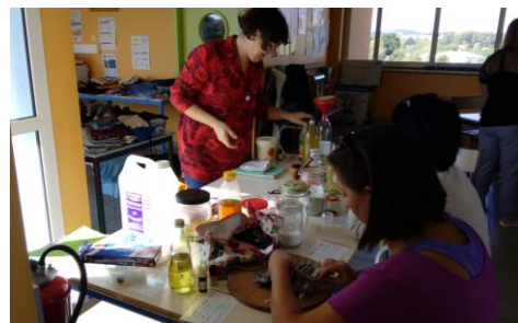
Atelier « Fabriquer ses produits d'entretien »