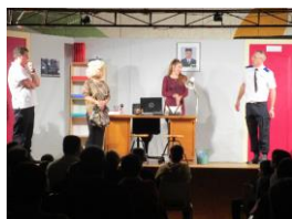
Soirée Théâtre « Gare au gorille »

Bilan de l'année 2018 : Accueil de loisirs Les P'tits Loups (4264 heures/enfants sur 35 jours d'ouverture pendant les vacances scolaires), bibliothèque relais de la bibliothèque départementale, soirée théâtre, vide-greniers, feux de la Saint Jean, marché de pays, atelier peinture, atelier couture, atelier arts graphiques, soirées parentalité, journées du patrimoine, chasse au trésor dans le village pendant les fêtes générales, stage vannerie.