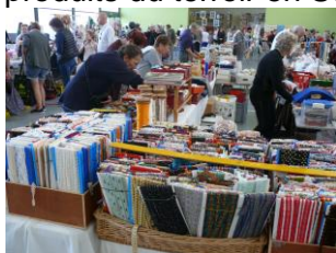
Puces des couturières

Le 30 septembre 2018, organisation des 1ères puces des couturières, loisirs créatifs et marché de produits du terroir en Ségala à Valderiès.