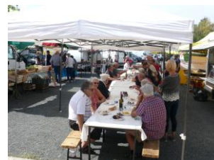
Marché de produits du terroir