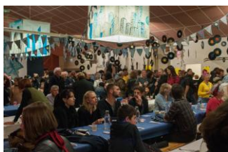
Fête annuelle de l'asso "Rock & Jean's"

Bilan de l'année 2018 : Friperies à Les Cabannes, Penne et Vaour - Gestion de l'EVS Pause Friperie à Penne - Week-end pressage collectif du jus de pomme et activités culturelles à Penne - Fête annuelle de l'association "Rock & Jeans"- Sortie famille week-end à la montagne - Marché et gouter de Noël - Centre de services - Salon de thé pendant le festival de l'Eté de Vaour - Création des Patous, un programme d'activités proposées par des habitants qui ont envie de sortir mais Pas Tout Seuls - Ateliers hebdomadaires de Yoga - Lettre d'Info mensuelle sur l'actualité des loisirs et services sur le territoire - 3 Lettre d'Infos spéciales Parents - Atelier Musculature profonde et connaissance de soi - Ateliers Création des décors de la fête - Atelier d'Initiation à la Taille des arbres fruitiers - Formation des bénévoles "Bonnes pratiques d'Hygiène et de Sécurité alimentaire" en prévision de l'ouverture du salon de thé Espace de Vie Sociale - Deux soirées Parentalité - Sensibilisation des secrétaires de mairie, professeurs des écoles et agents de la MSAP sur les violences faites aux femmes, avec l'association "Paroles de femmes"