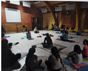
Initiation au Qi- gong

Bilan de l'année 2018 : Atelier chant tous les mardis à 20h ; cours de danse traditionnelle tous les mardis à 21h - un bal organisé avec Bernard Gaches - atelier mémoire un mardi par mois - Atelier Echanges et Créations tous les jeudis à 13h30 - après-midis récréatifs un mercredi par mois pour les enfants : bricolage, cuisine, activités manuelles – randonnée tous les mercredis à 20h de juin à août – organisation de Noël – soirée tri pour la friperie Familles Rurales de Marssac – téléthon – octobre rose – initiation au Qi-gong pour adultes et enfants.