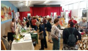
Journée AEC Familles Rurales